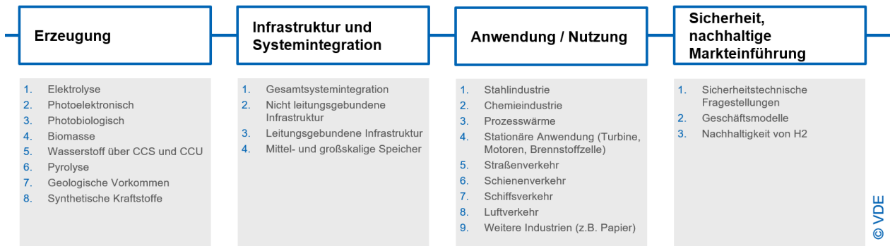
Abbildung 1 Die Bereiche der Wasserstoffwertschöpfungskette (Eigene Darstellung VDE)

Die Transformation unserer Energiesysteme sorgt für Änderungen im Arbeitsumfeld vieler Menschen, die einige als Chance nutzen können. Darüber hinaus sorgen die Komplexität der Energiewende und der damit einhergehende steigende Bedarf an Wasserstoff aktuell dafür, dass es zu diesem Thema einen regelrechten Boom auf dem Schulungsmarkt gibt. Dies macht es für Interessierte und relevante Zielgruppen schwierig die richtige Schulung, welche die praxisrelevanten Inhalte liefert, zu finden.